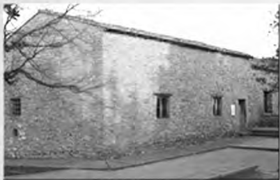
Casa natale di Leonardo da Vinci nato il 15 aprile 1452 ad Anchiano