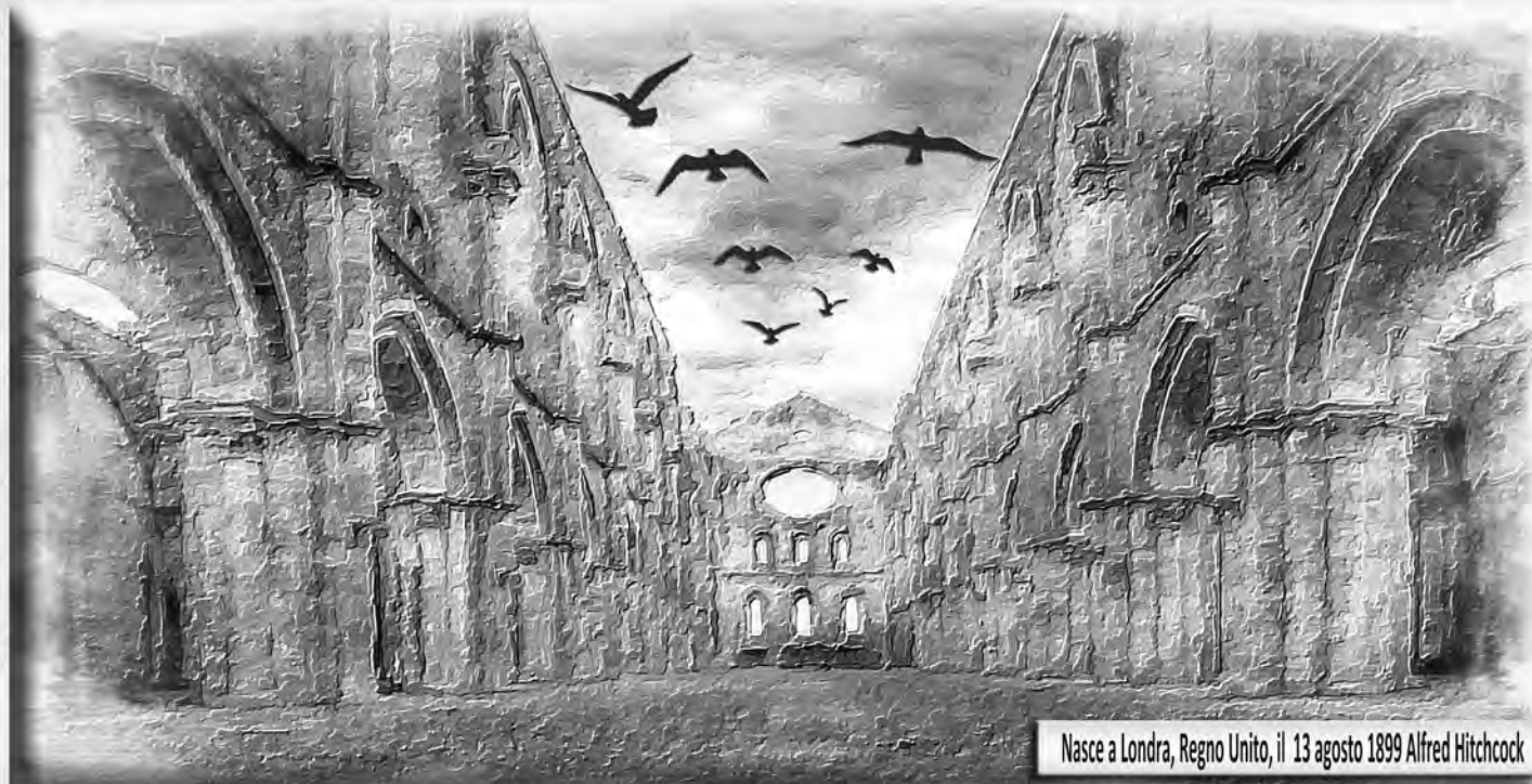
Nasce a Londra, Regno Unito, il 13 agosto 1899 Alfred Hitchcock