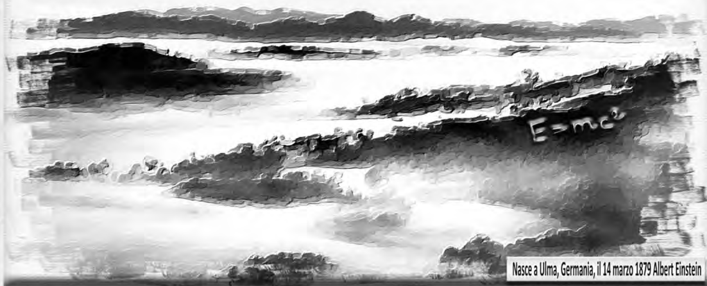
Nasce a Ulma, Germania, il 14 marzo 1879 Albert Einstein