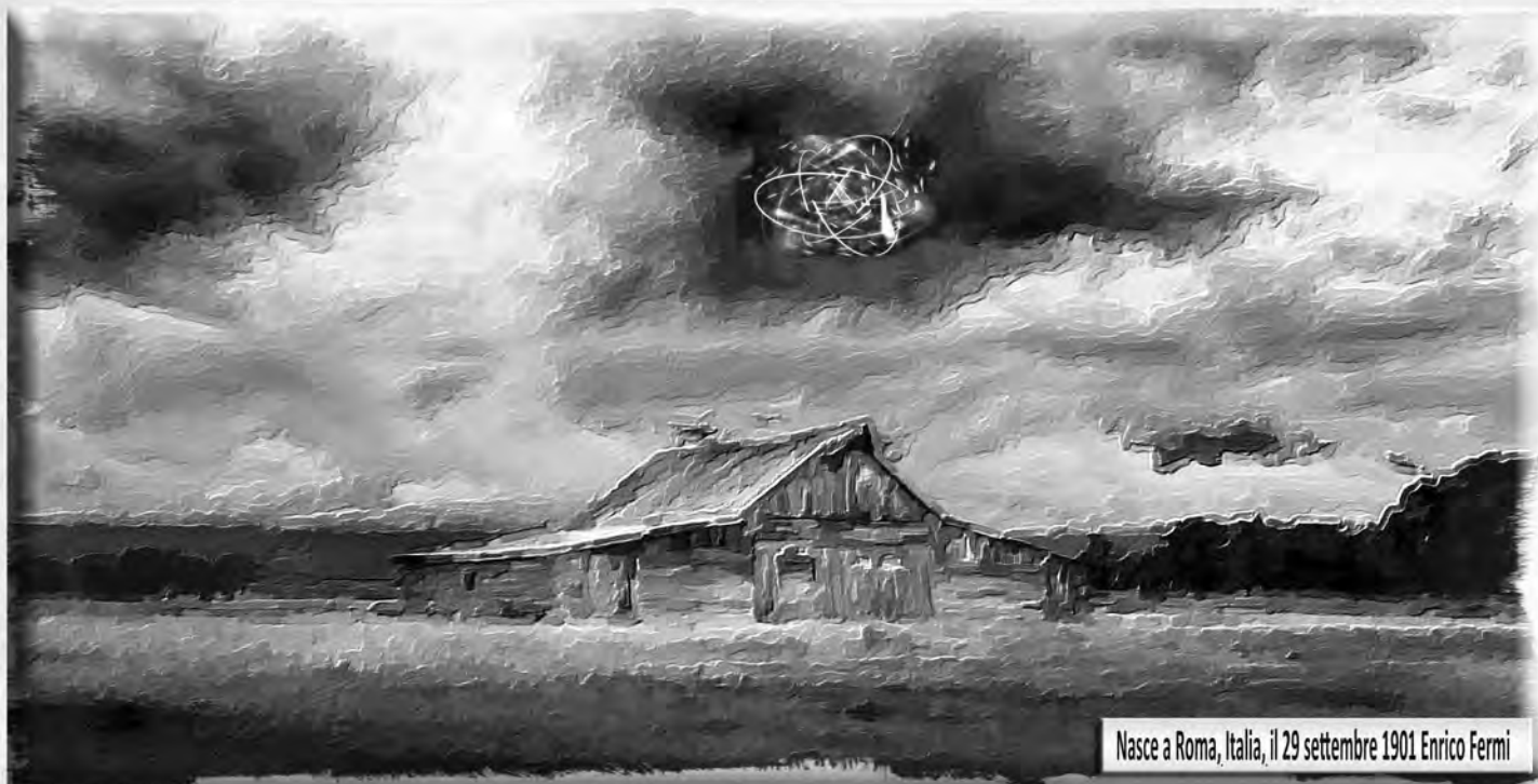
Nasce a Roma, Italia, il 29 settembre 1901 Enrico Fermi