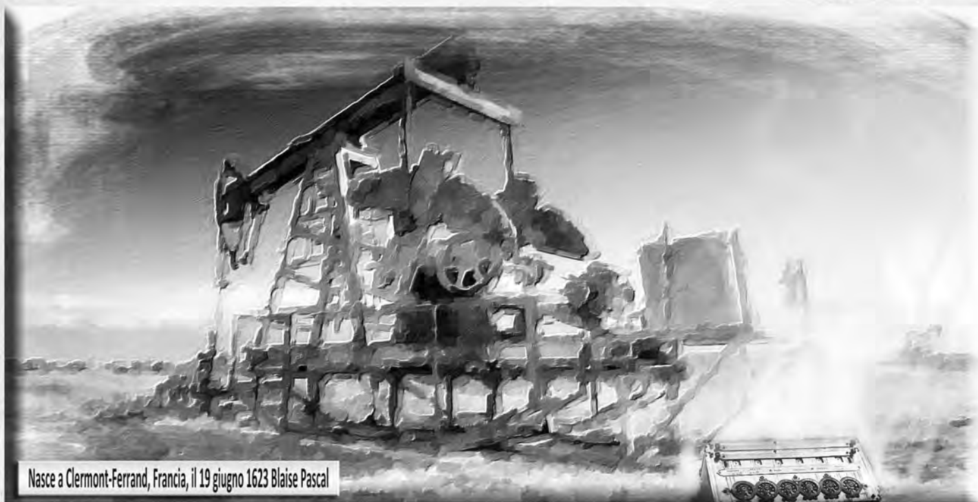
Nasce a Clermont-Ferrand, Francia, il 19 giugno 1623 Blaise Pascal