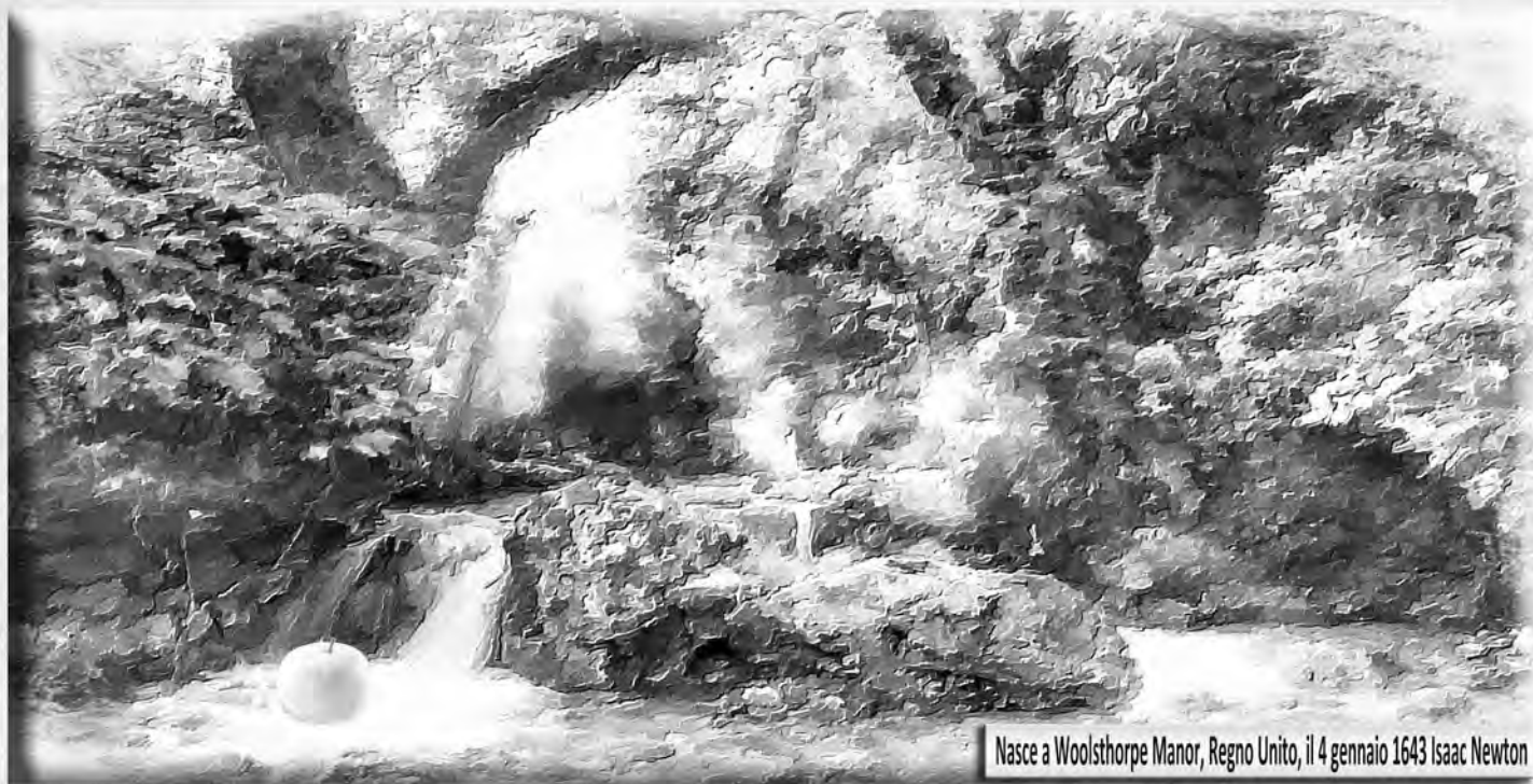
Nasce a Woolsthorpe Manor, Regno Unito, il 4 gennaio 1643 Isaac Newton