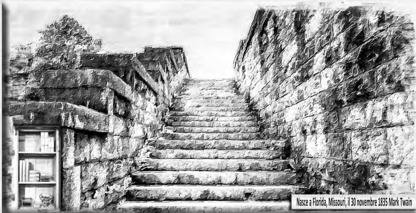
Nasce a Florida, Missouri, il 30 novembre 1835 Mark Twain