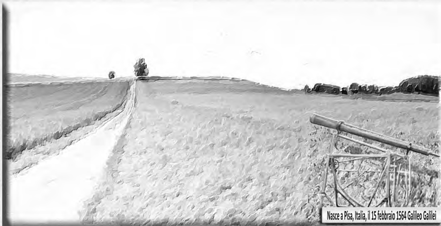
Nasce a Pisa, Italia, il 15 febbraio 1564 Galileo Galilei