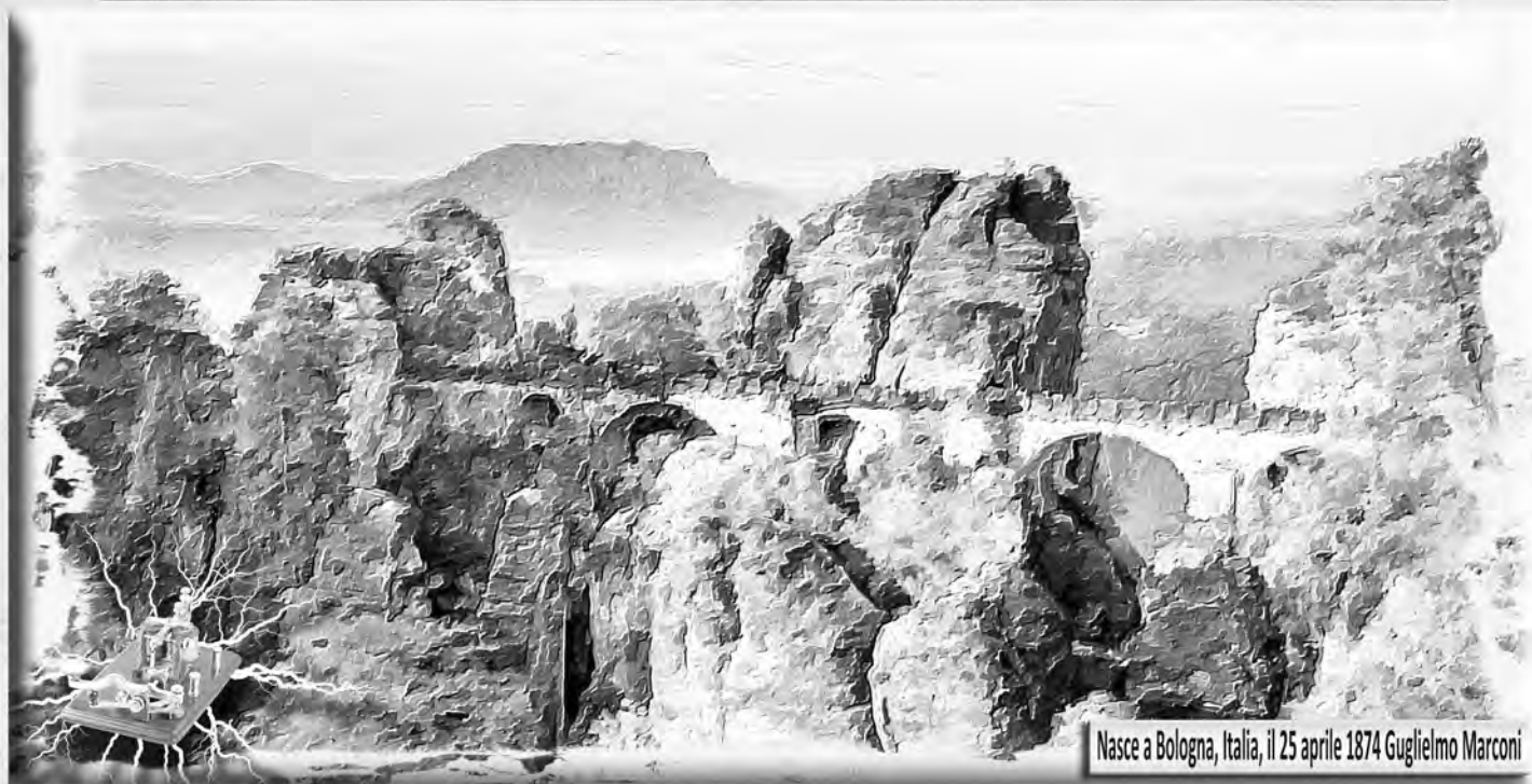
Nasce a Bologna, Italia, il 25 aprile 1874 Guglielmo Marconi