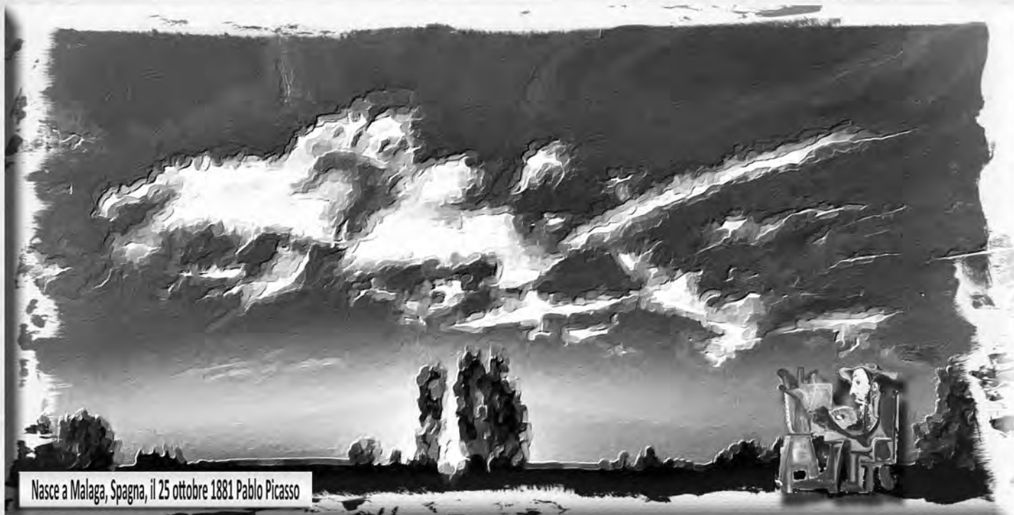
Nasce a Malaga, Spagna, il 25 ottobre 1881 Pablo Picasso