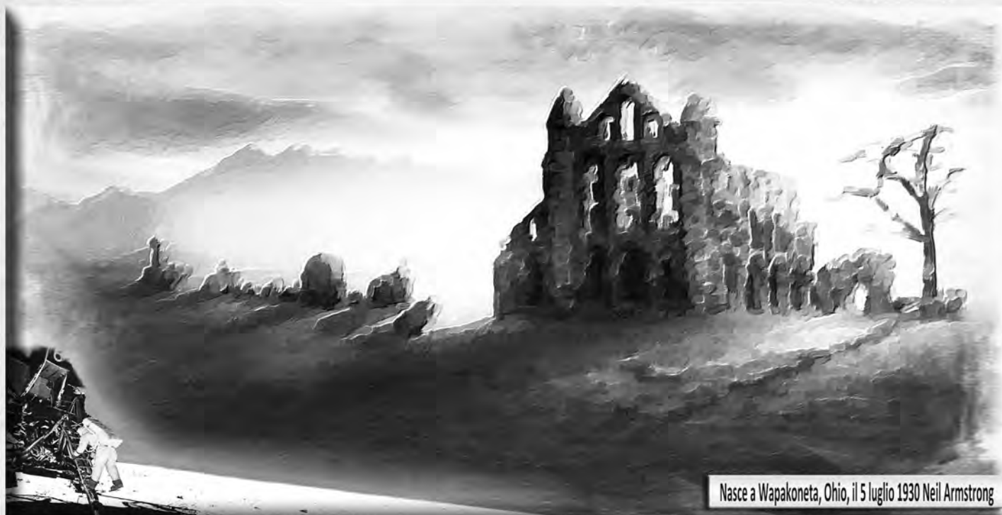
Nasce a Wapakoneta, Ohio, il 5 luglio 1930 Neil Armstrong