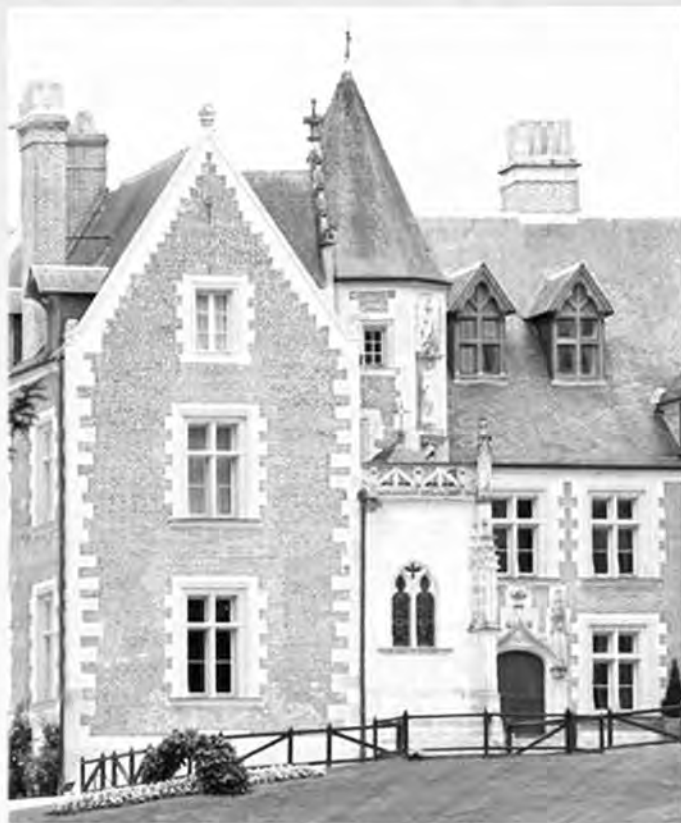
Château du Clos Lucé, dimora degli ultimi tre anni di vita di Leonardo da Vinci