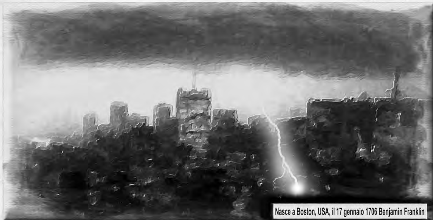
Nasce a Boston, USA, il 17 gennaio 1706 Benjamin Franklin