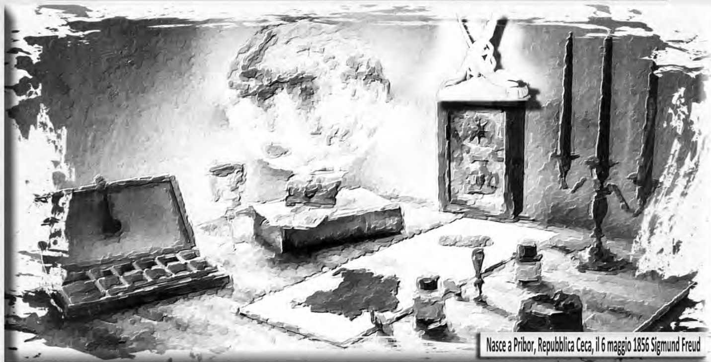
Nasce a Pribor, Repubblica Ceca, il 6 maggio 1856 Sigmund Freud