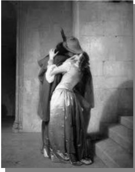
Il bacio - Francesco Hayez

Sono nato nel 1976 a Genova, dove tuttora abito. Oltre alla passione per la lettura ogni tanto scrivo racconti brevi, che spaziano da un taglio romantico al thriller per arrivare a storie intrise di ironia. È sempre una soddisfazione quando vengo incluso nelle antologie dei concorsi letterari, perché verrò letto da una cerchia maggiore rispetto a parenti e amici.