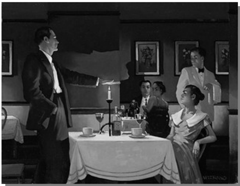
A test of true love - Jack Vettriano