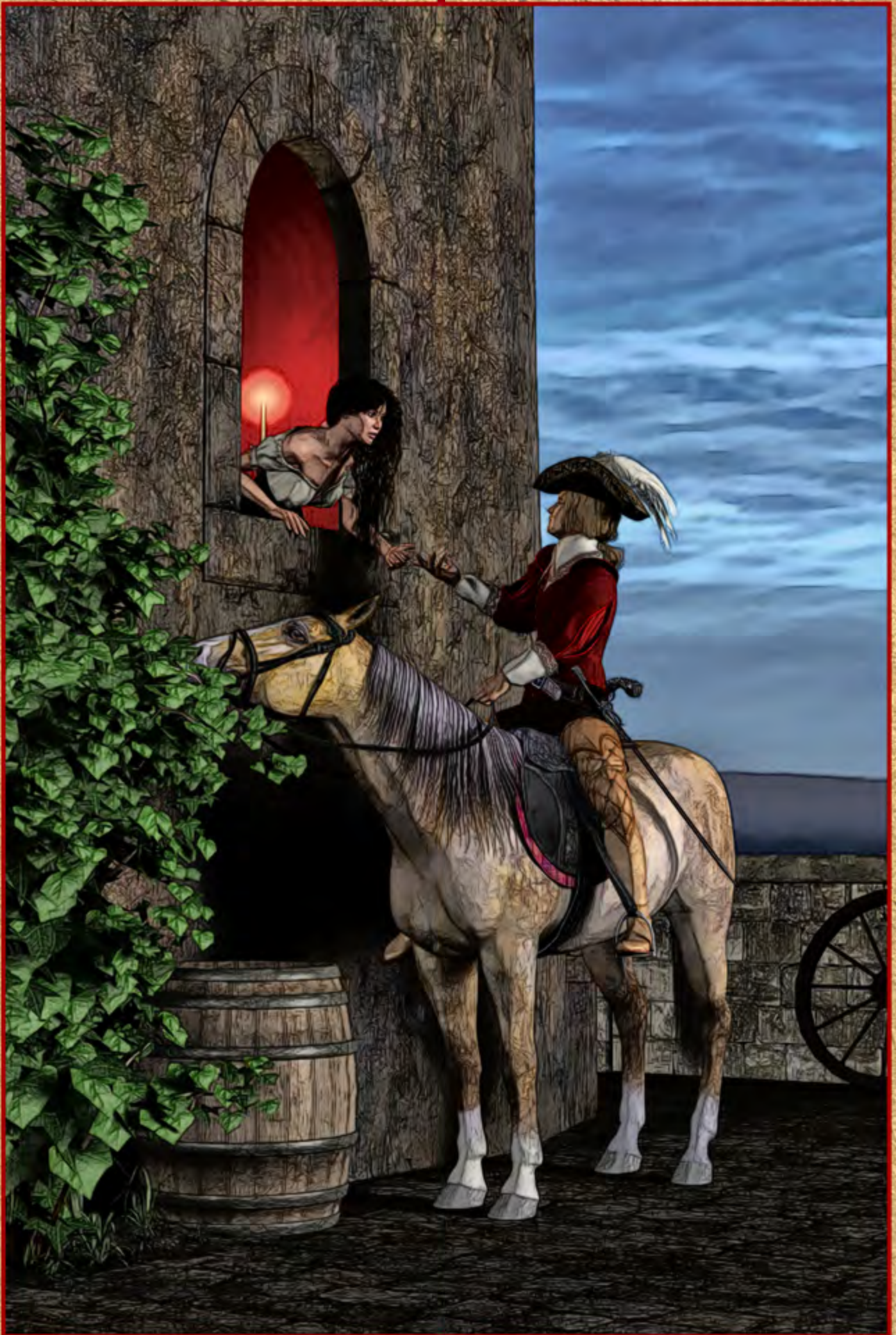
The Highwayman ▲