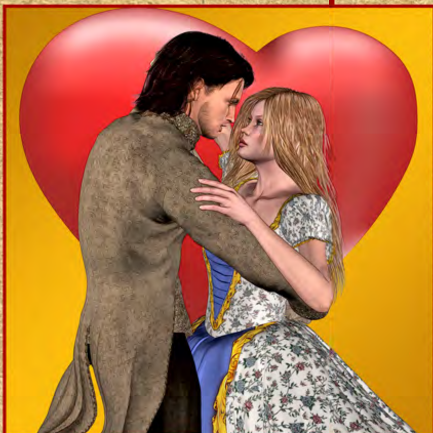
▼ Ballano Cuori