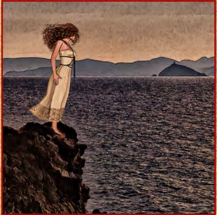
Mare da Morire ▲