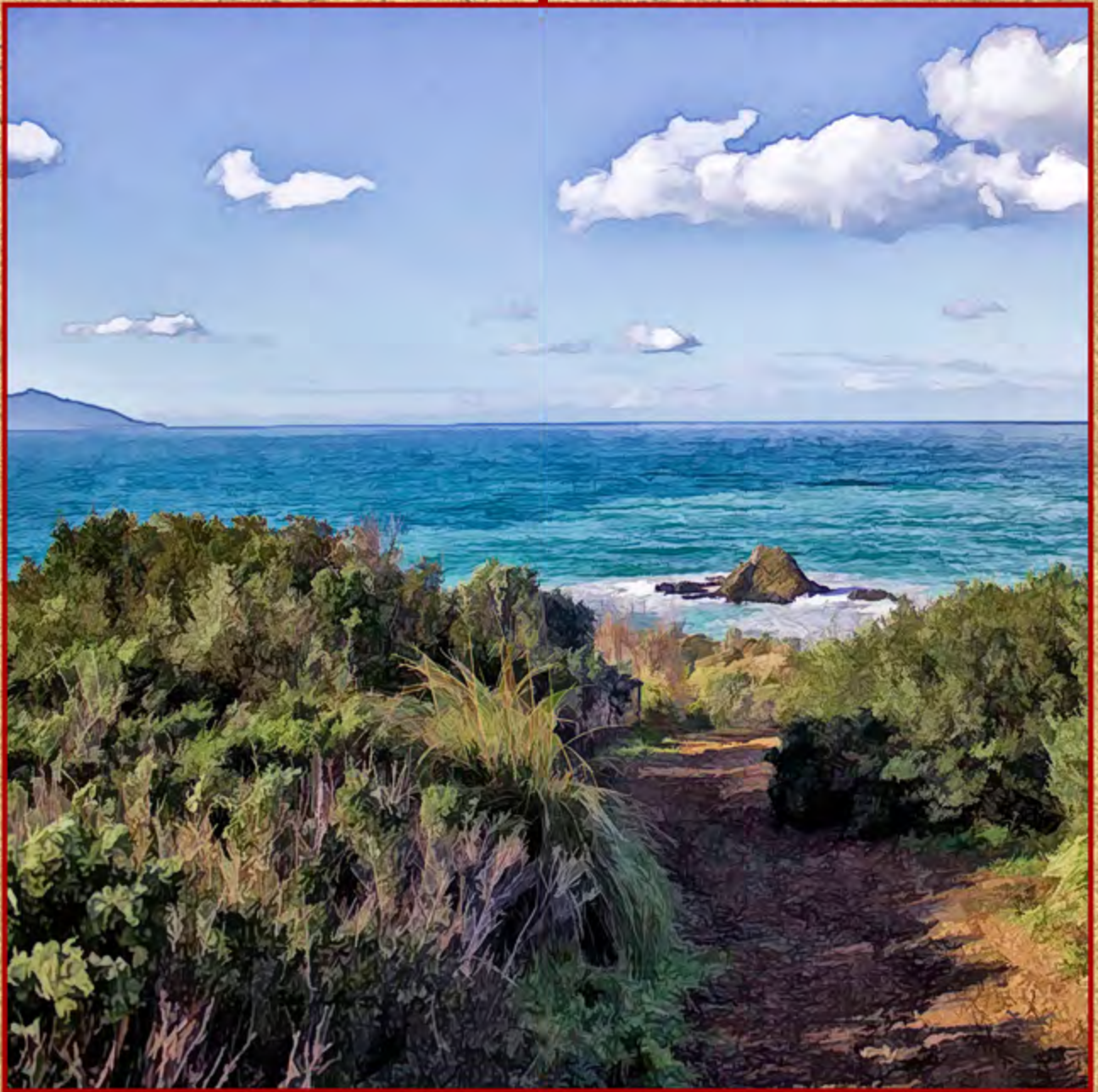
Lo Strunzo d'Orlando ▲