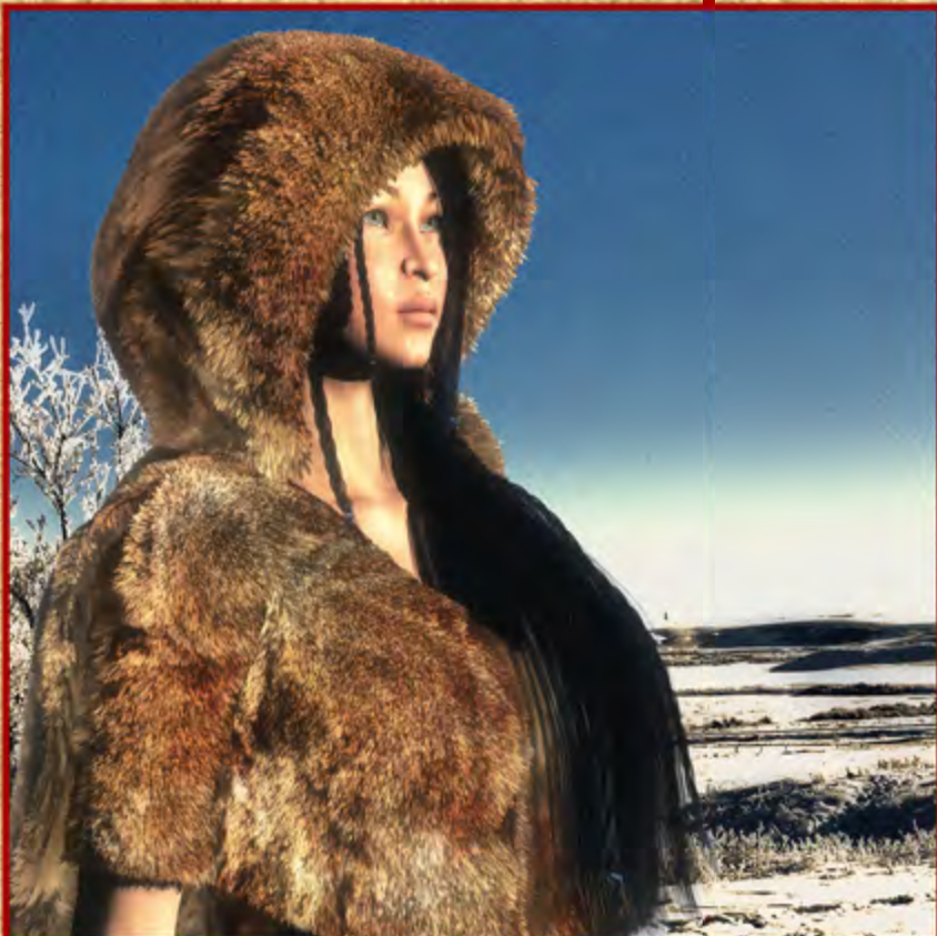
▼ La Principessa delle Praterie