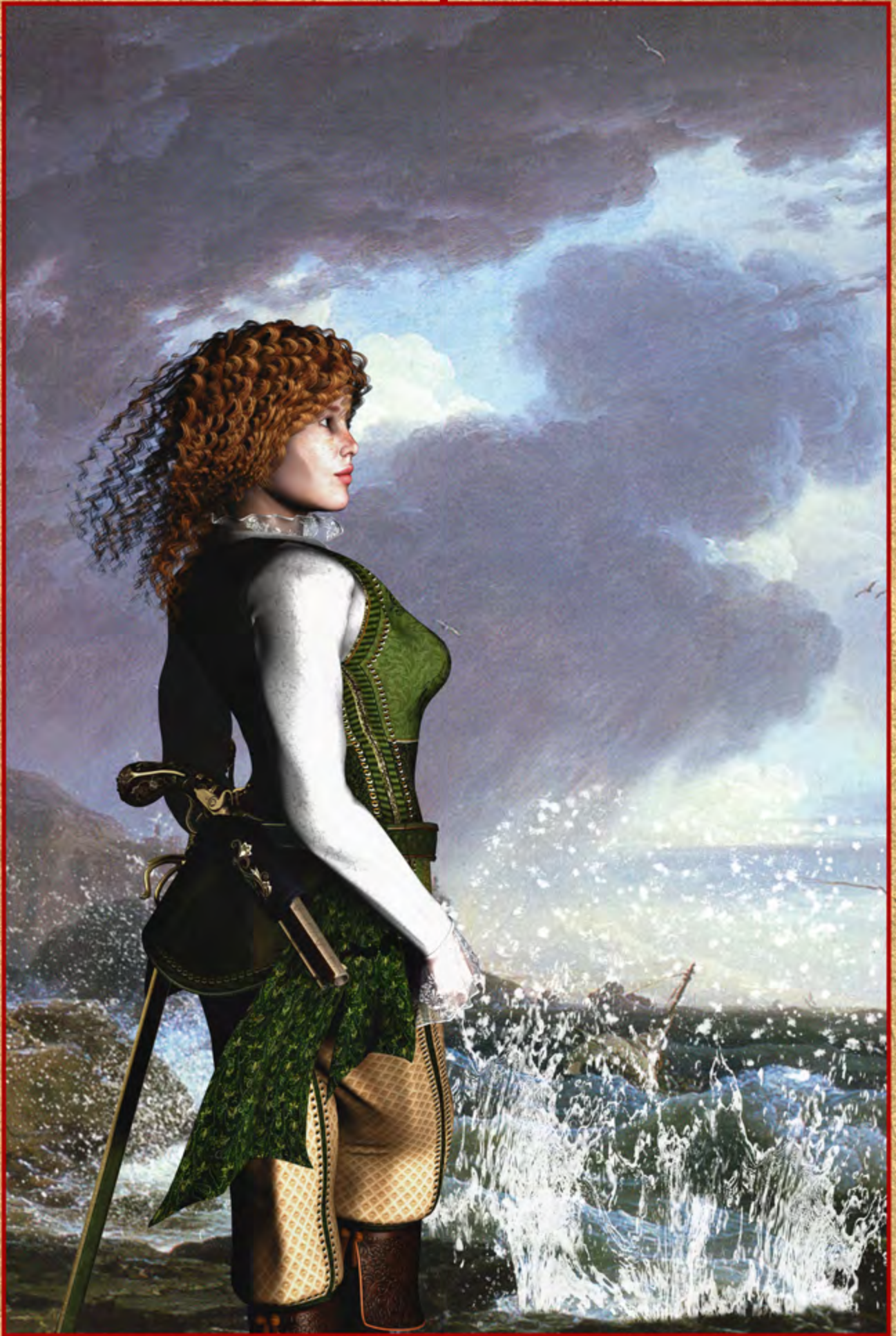
Ivory Foam ▲