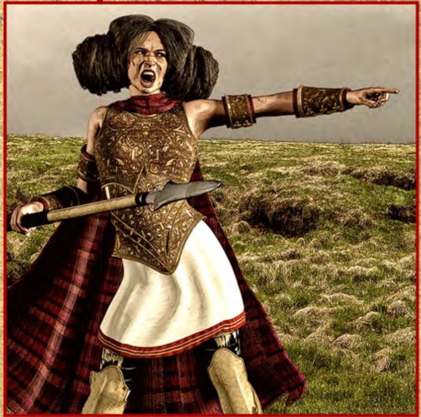
Mag Tuired ▲