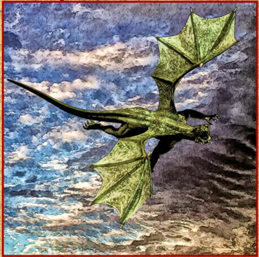
Cieli Pericolosi ▲