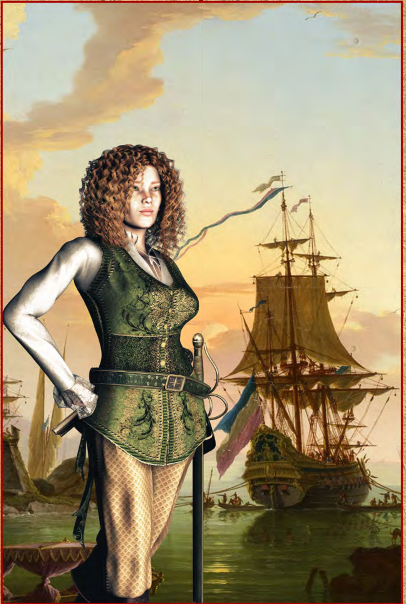
Dreaming of Northern Shores ▲