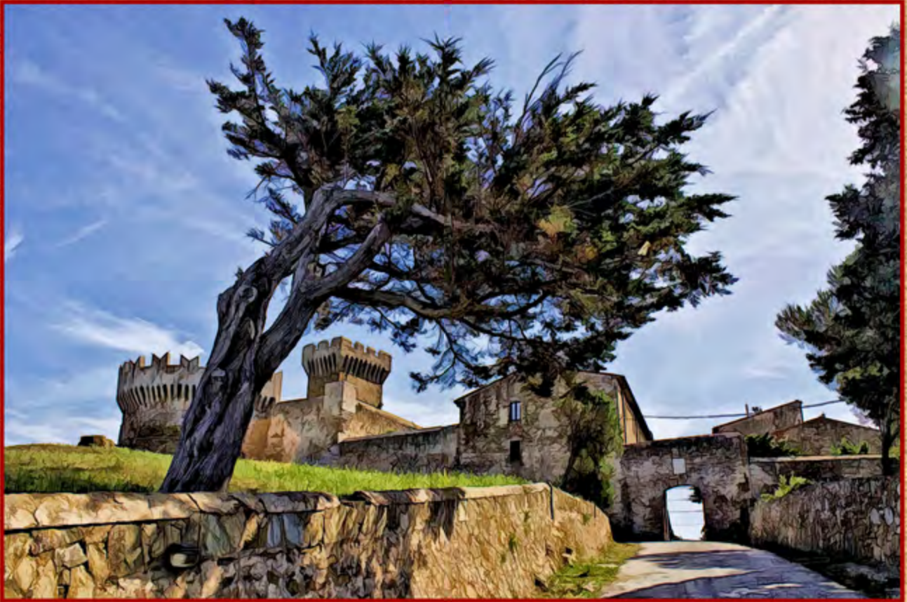
La Porta di Populonia ▲