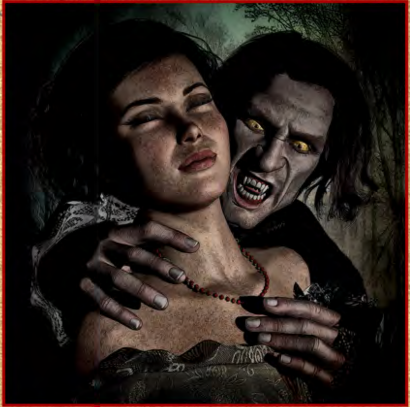
Sanguis Vita Est ▲