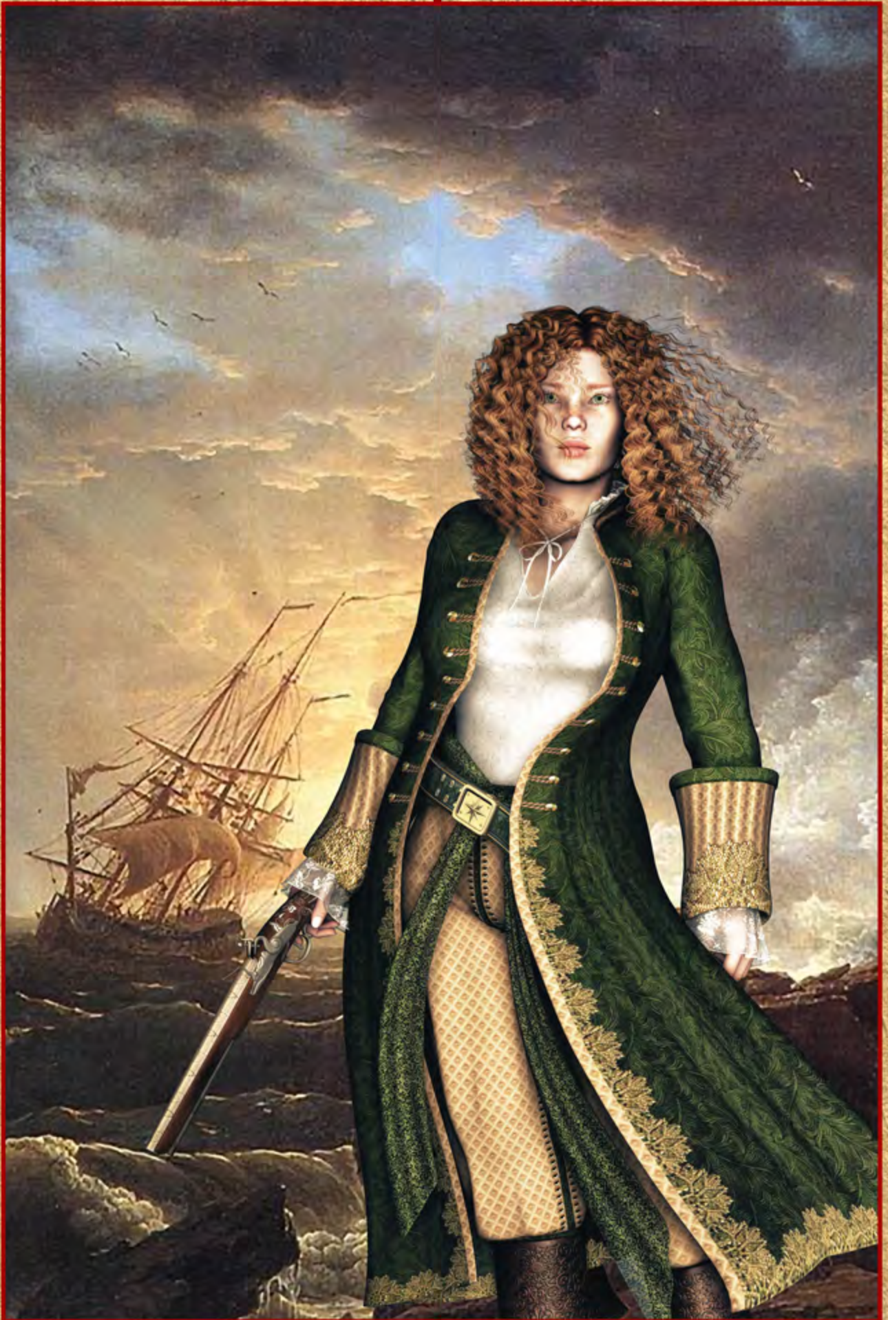
Dreaming of Treasures ▲