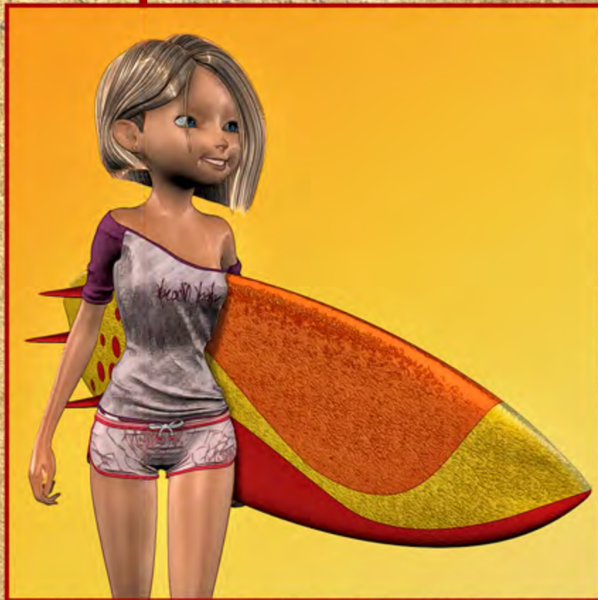
Surfin' USA ▲