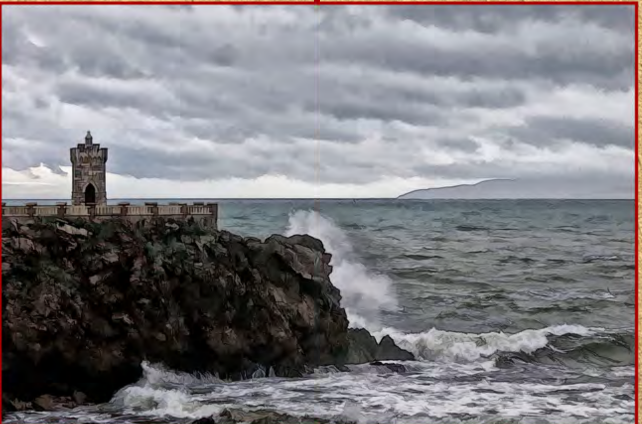
▼ Mareggiata alla Rocchetta